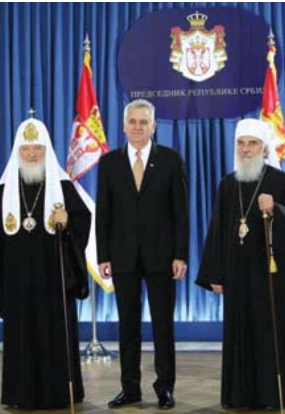
Председник Томислав Николић са Његовом светошћу руским патријархом Кирилом и Његовом светошћу српским патријархом Иринејем