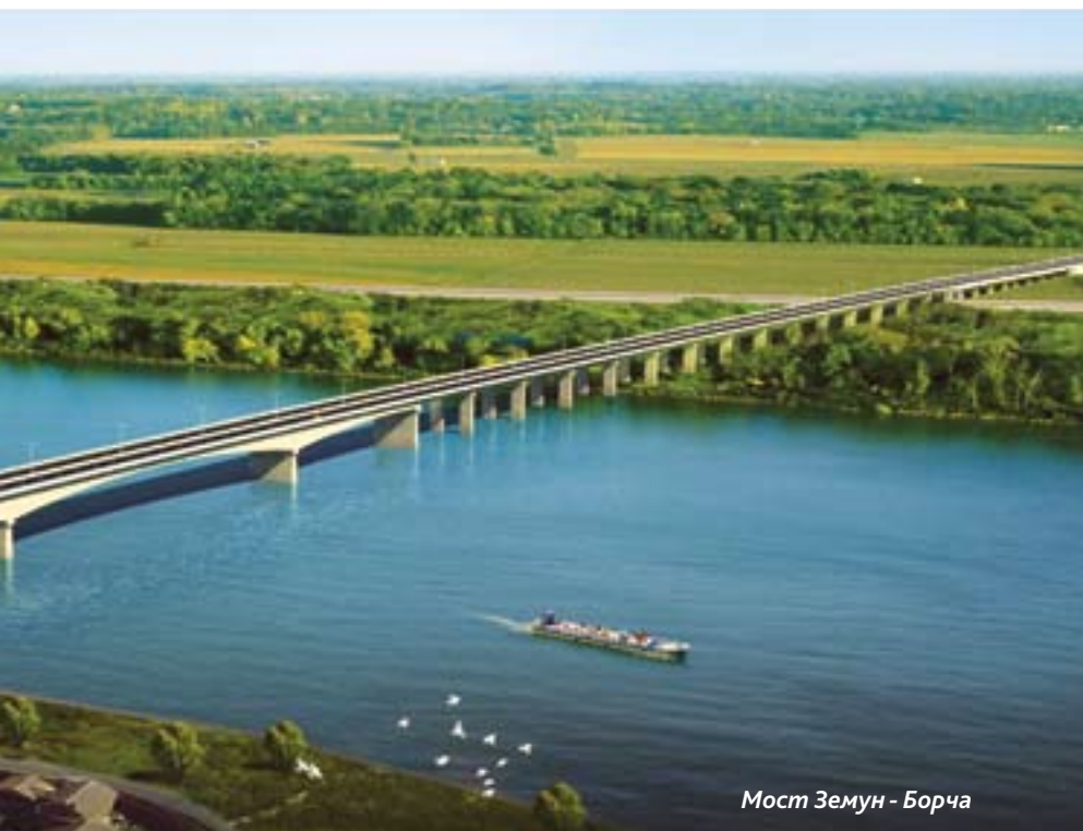
Мост Земун - Борча