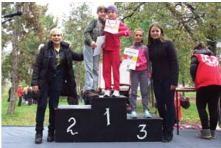
Ниш - Црвени крст